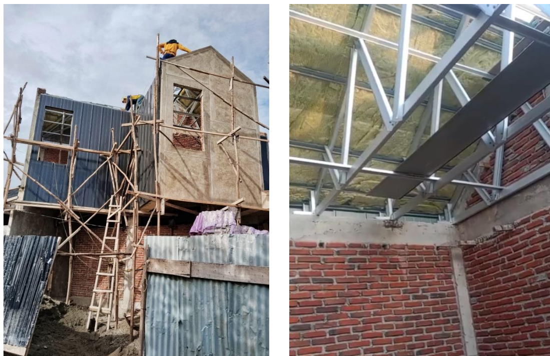
Gambar 3. Pemasangan Glasswool pada Atap

Seluruh proses pemasangan dilakukan secara langsung oleh peserta pelatihan di bawah supervisi instruktur teknis, dengan pendekatan demonstratif dan partisipatif agar pemahaman dan keterampilan dapat terserap secara optimal. Pemasangan Glasswool pada atap dapat dilihat pada Gambar 3.