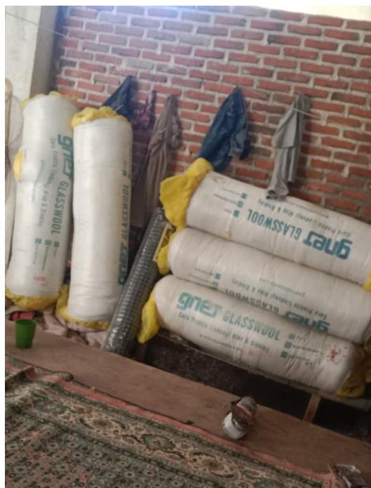
Gambar 2. Material Glasswool yang Digunakan

material pendukung seperti wiremesh, paku, kawat pengikat, dan alat pelindung diri (APD). Adapun material Glasswool yang digunakan pada pelatihan ini memiliki spesifikasi ketebalan 50 mm, dengan ukuran 1,2 x 15 m, seperti ditunjukkan pada Gambar 2.