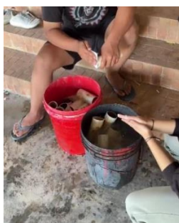
Gambar 2. Proses Pembersihan Bahan Daur Ulang