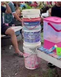
Gambar 1. Bahan Daur Ulang (Ember Bekas Cat)

Pada tahap awal, tim akademisi melakukan observasi dan koordinasi dengan pengurus Kampung Kreatif Sugih Waras untuk mengidentifikasi titik rawan sampah, dan juga mengajak Masyarakat setempat untuk mengumpulkan bahan daur ulang. Tim akademisi juga memberikan penjelasan awal mengenai nilai guna arsitektur dan fungsi tong sampah. Dan juga mempersiapkan apa saja bahan yang akan digunakan, bahan yang digunakan seperti ember bekas cat, cat/pewarna, kayu dan lain sebagainya (Hardi et al., 2020).