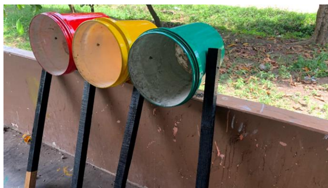
Gambar 5. Warna Tong Sesuai Jenis Sampah