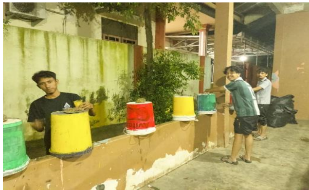
Gambar 4. Total Tong Sampah yang Telah Dibuat

Pembuatan tong sampah itu menghasilkan 6 tong sampah dengan masing-masing jenis sampah ada 2 tong sampah. Tong sampah ini di letakkan pada bagian tertentu seperti pada titik kumpul pada kegiatan komunitas, depan balai desa, lapangan dan lainnya.