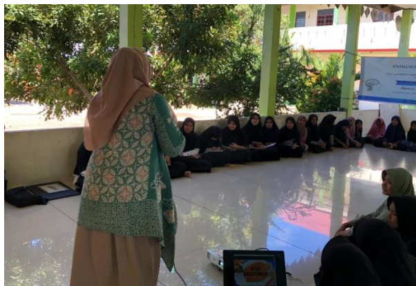
Gambar 1. Sesi Penyampaian Materi

Tahap keempat yakni brainstorming yang dilakukan kepada siswa dan pengasuh asrama. Pada sesi ini, peserta dibagi menjadi 3 kelompok kecil, dimana dalam satu kelompok terdapat sepuluh sampai sebelas siswa untuk melakukan brainstorming mengenai bentuk-bentuk bullying yang pernah mereka alami atau saksikan di lingkungan dayah. Hasil diskusi menunjukkan bahwa bullying verbal, seperti ejekan dan penghinaan, adalah jenis yang paling sering terjadi di dayah. Selain itu, beberapa siswa juga melaporkan pengalaman terkait bullying sosial, seperti pengucilan dari kelompok pertemanan, yang berdampak pada rasa rendah diri dan isolasi sosial bagi korban. Sesi brainstorming ini juga mengungkap bahwa sebagian besar pelaku bullying tidak selalu menyadari dampak dari tindakan mereka, karena dianggap sebagai bagian dari candaan atau dinamika pertemanan. Temuan ini menekankan pentingnya sosialisasi lanjutan mengenai batas-batas interaksi sosial yang sehat dan tidak menimbulkan rasa sakit hati atau ketidaknyamanan bagi orang lain.