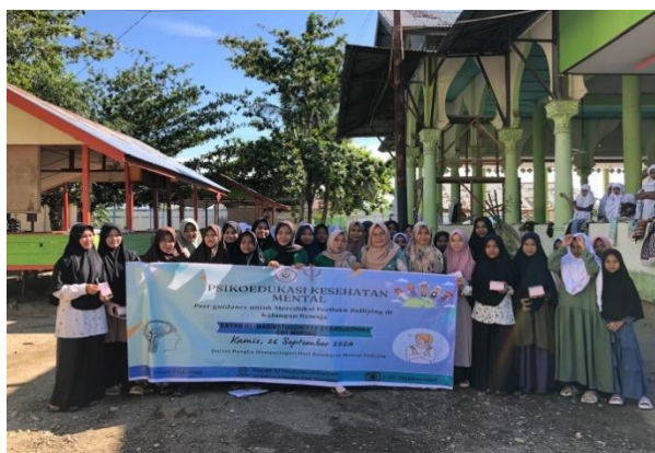
Gambar 3. Sesi Foto Bersama