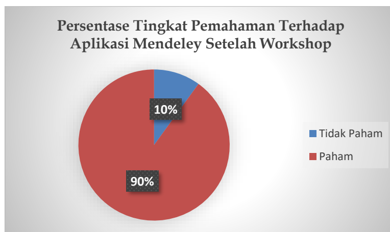
Gambar 4. Persentase Tingkat Pemahaman Terhadap Aplikasi Mendeley Setelah Workshop

Namun, setelah dilaksanakannya workshop pengabdian kolaborasi ini, hal tak terduga bahwa Tingkat kemampuan menguasai aplikasi Mendeley peserta naik signifikan. Berikut dapat dilihat grafik peningkatannya: