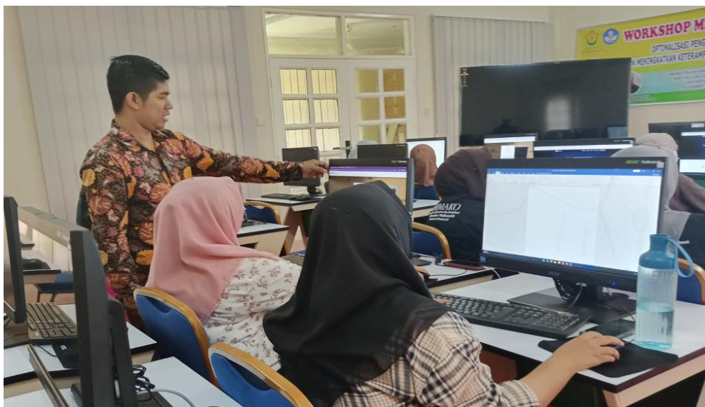
Gambar 1. Kegiatan Workshop Mendeley Berseri di Lab Komputasi dan Analisis Data FISIP Universitas Malikussaleh dilaksanakan pada Hari Selasa, Tanggal 31 Oktober 2023