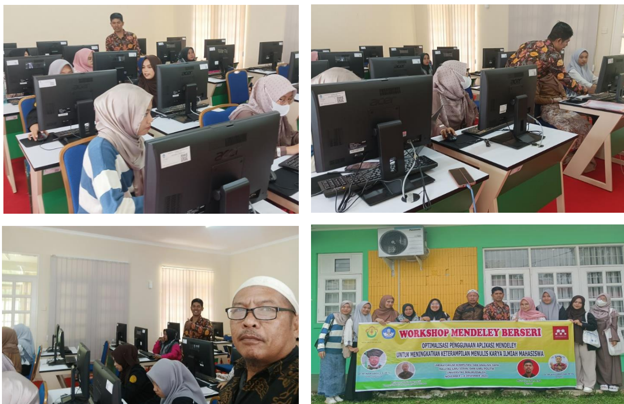
Gambar 2. Kegiatan Workshop Mendeley Berseri di Lab Komputasi dan Analisis Data FISIP Universitas Malikussaleh dilaksanakan pada Hari Selasa, Tanggal 31 Oktober 2023

Adapun pelaksanaan pada sesi siang, mulai pukul 14.00-16.00 Wib, narasumber memberikan kesempatan kepada peserta untuk mempraktekkan teori dan cara penggunaan aplikasi Mendeley kepada masing-masing mahasiswa untuk menerapkan pada draft proposal skripsi yang telah disiapkan. Waktu yang disediakan untuk praktek langsung adalah 2,5 jam atau setara 150 menit. Praktek ini memberikan kesempatan untuk melatih diri bagaimana cara menggunakan aplikasi Mendeley secara benar dan tepat, hal ini akan membantu mahasiswa menguasai secara utuh terhadap aplikasi sehingga dapat diaplikasikan dalam rangka memudahkan penyusunan skripsi sebagai tugas akhir mahasiswa diprodi masing-masing.