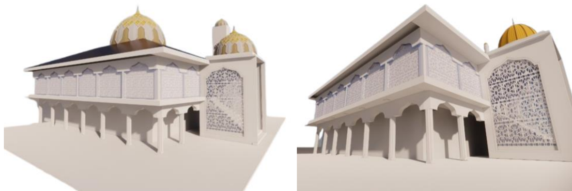
Gambar 3. Bentuk Permodelan Fasad Kinerja Redesain Masjid

Perancangan konsep desain pada kegiatan redesain wujud fasad masjid yang menjadi sisi utama permodelan adalah sisi depan masjid bagian kiblat karena sebagai bagian kepala bangunan dari arah horizontal sebagai konsep silaturahmi antar umat muslim (ibadah sosial). Sedangkan sisi utama permodelan utama secara vertical terletak pada sisi kubah masjid sebagai pengantar ajaran ke-Ilahian dalam konsep ibadah spiritual. Sedangkan sisi visual fasad dinding masjid merupakan media falsafah kehidupan Masyarakat setempat yang terinterpretasi melalui simbol-simbol kearifan lokal masyarakat setempat sebagai penghubung antara ibadah spiritual dan ibadah sosial redesain arsitektural fasad masjid.