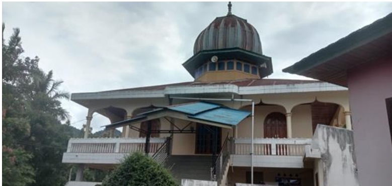
Gambar 1. Eksisting Redesain Visual Fasad Masjid

kepemilikan masyarakat terhadap rumah ibadah mereka. Redesain ini juga menjadi sabagai interpretasi identitas masyarakat setempat. Sedangkan sebagai keberlanjutan kebudayaan atau cara hidup masyarakatnya terinterpretasi dari karakter visual fasad masjid sekaligus juga sebagai sarana pembelajaran nyata dalam penerapan ilmu arsitektur di lapangan, di mana teori dan praktik diintegrasikan dalam konteks sosial, agama dan budaya yang nyata (Hasibuan, 2017), (Brahmana et al., 2013).