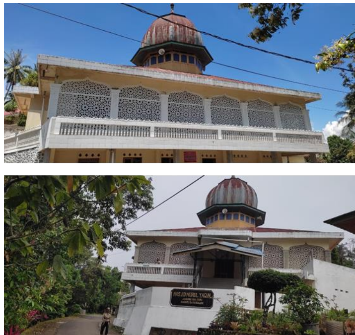
Gambar 5. Setelah Pemasangan Fasad

Secara konseptual, desain fasad Masjid Nurul Yaqin juga menghadirkan reinterpretasi terhadap nilai-nilai tauhid, ukhuwah, dan ihsan dalam wujud visual. Bentuk simetri dan repetisi pola mencerminkan ketertiban dan kesempurnaan ciptaan Allah warna putih menjadi simbol kesucian niat dalam beribadah sementara keterbukaan fasad dengan bukaan lebar menandakan inklusivitas Islam yang mengundang semua umat untuk mendekat kepada Sang Pencipta. Dengan demikian, redesain ini bukan hanya memperindah bangunan secara fisik, tetapi juga menghidupkan kembali makna spiritual yang melekat pada setiap unsur arsitekturalnya.